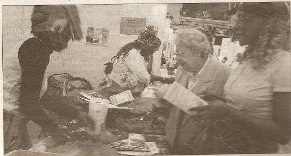
Près de 20 associations (ici, Aide Cameroun) participent pour la première fois à ce forum.

► Ouvert encore aujourd'hui, de 10 à 19 heures. Entrée libre.